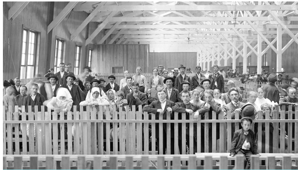
Locust Point ha sido llamado la "Isla Ellis de Baltimore" por haber sido el 3er mayor punto de entrada de inmigrantes a los EE. UU. después de Nueva York y Filadelfia.

MORA ha ayudado a que más de 40.000 refugiados hagan de Maryland su hogar, facilitando su transición de "personas desplazadas" a miembros independientes que contribuyen a la economía nacional y a las comunidades locales. Nosotros trabajamos mediante una red de proveedores de servicios públicos y privados, para planear, administrar y coordinar servicios de transición, destinados a ayudar a que los refugiados sean autosuficientes tan pronto como sea posible. Las áreas clave para ayudar a los refugiados a adaptarse a la vida americana incluyen ayuda financiera, ubicación laboral, orientación comunitaria, enseñanza de inglés y capacitación profesional, apoyo académico para jóvenes, manejo de casos y otros servicios de apoyo.